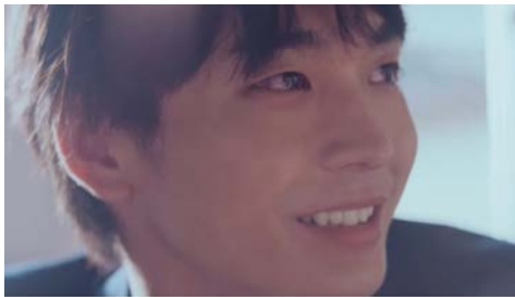
▶ 山口フィナンシャルグループ YMFG 「はじめの一步」篇