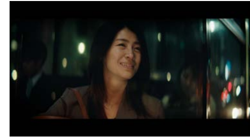
▶ Amazon Amazonプライム 思いのまま