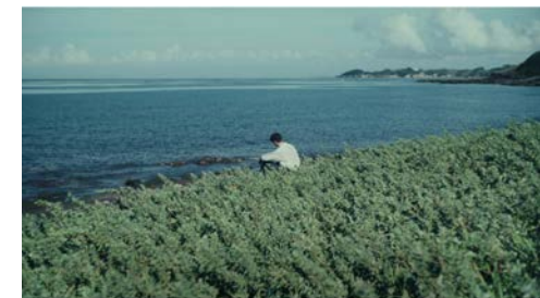
▶ ダイワハウス かぞくの群像#5「不在」篇