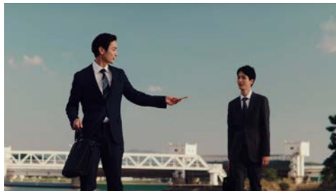
▶ 山口フィナンシャルグループ ユズの場合#2