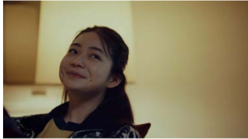
大和ハウス かぞくの群像 #6 「ヤンさんの溝」篇