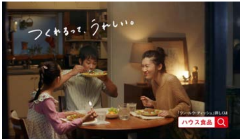
ハウス食品 「ワン・ルウ・ディッシュ つくれるが、ひろがる。<タコライス篇>」