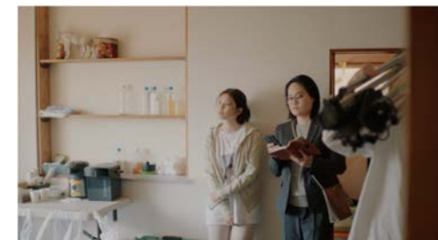
▶ 電気事業連合会 「電気とひとの物語・この撮影も」篇