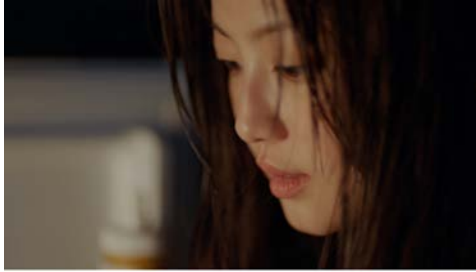
電気事業連合会 「電気とひとの物語・冷蔵庫あけたら」篇