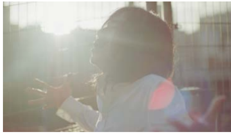
宮本浩次 -Today-胸いっぱいのお愛-