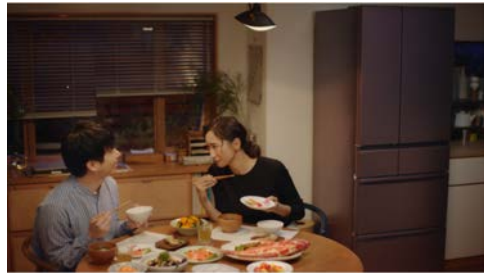
三菱電機 三菱冷蔵庫「とある家族と冷蔵庫」篇