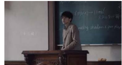
大和ハウス かぞくの群像 シリーズ