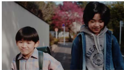
▶ ダイワハウス かぞくの群像#3「秘密」篇