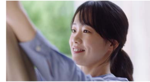
大鵬薬品 Efi「出かける家族」篇