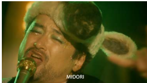
▶ マダム ピフェスタ「自由なクレンジング」篇