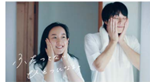
▶ pdc ビュアナチュラル 「ふたりの朝」「一緒に入っちゃう?」 「ふたりは歳を重ねて」