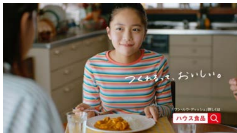
ハウス食品 「ワン・ルウ・ディッシュ つくれるが、ひろがる。<バターチキンカレー>」篇