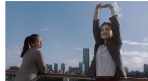
AOKI リラジャケ 「働く女性たち」篇