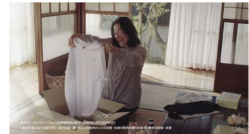
リライブシャツα 贈る、リライブ。