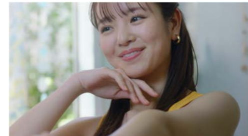
ミュゼプラチナム ミュゼ姉妹篇/悩めるいとこ篇