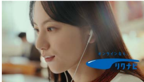
▶ リクナビ 「言ってよー」篇/「今、取り込み中」篇