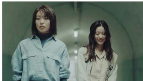
▶ ダイワハウス かぞくの群像#4「青音」篇