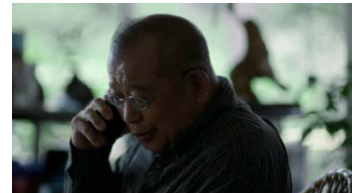
▶ シオノギヘルスケア kippa 「親の想い」篇/「子の想い」篇