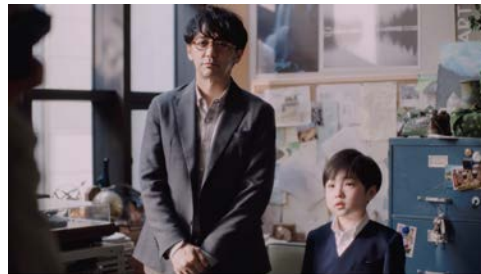
▶ 大和ハウス工業「かぞくの群像」#1