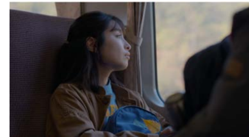
▶ JR東日本 自分の世界に、まだない場所へ。東北へ 世界の広さ篇