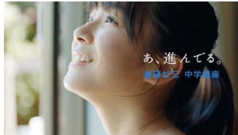
▶ ベネッセコーポレーション 進研ゼミ 中学講座 プレゼンティッド学習篇