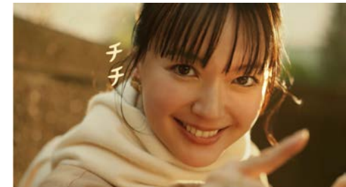
マクドナルド とろ〜り3種のチーズのビーフシチューパイ