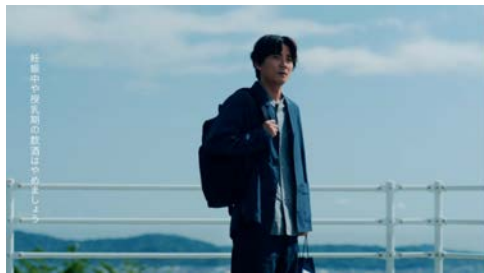
SUNTORY WORLD WHISKY 碧Ao 父の日は、父と碧Ao