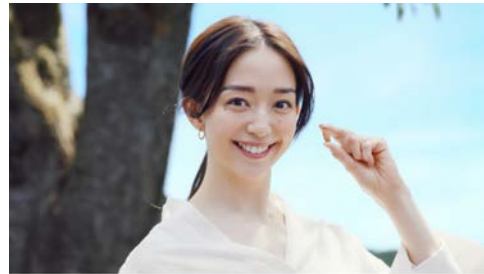
▶ 江崎グリコ アーモンド効果 アーモンドの木篇