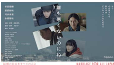
▶ Marriage For All Japan 短編映画「誰も悪くないのにね」