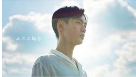
▶ 山口フィナンシャルグループ ユズの場合篇