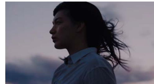
山口フィナンシャルグループ イノリの場合篇