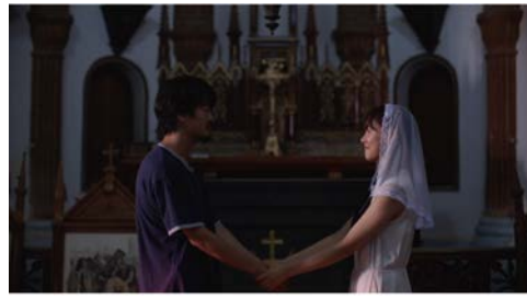
▶ 短編映画「リッチャン、健ちゃんの夏。」