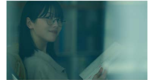
SHARP 空気清浄機「空気とは、」撮取篇/呼吸篇