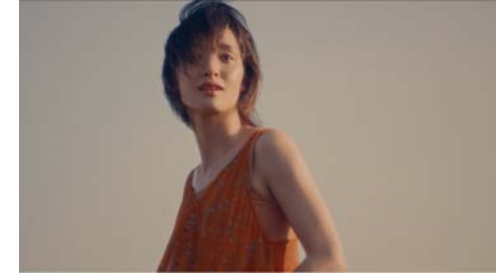
▶ クリエイターズ支援プロジェクト製作委員会 「卵と彩子」