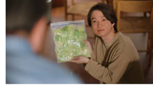
三菱冷蔵庫 「冷凍できる時代」篇