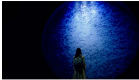
▶ JR東日本【東京へ篇】自分の世界に、まだない場所へ。/ 【東北へ篇】自分の世界に、まだない場所へ。