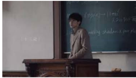
大和ハウス かぞくの群像 #7 「十三歳」篇/「矛盾と十三歳」篇