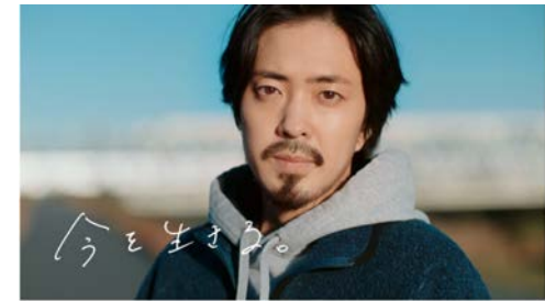
▶ ダイワハウス かぞくの群像#2「萌芽」篇