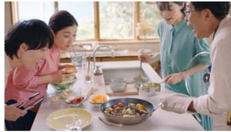
▶ 三菱電機 三菱冷蔵庫「しあわせの間」篇