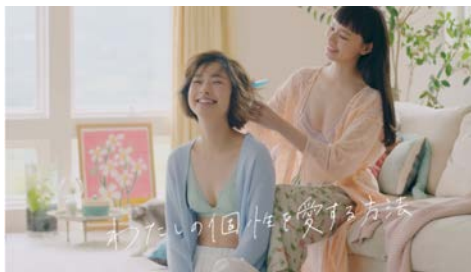
ワコール Wing 22AW 綿の賢沢/マッチミーブラ ウェルアップ/マッチミーブラシリーズ